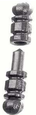
Ø29 130 R61.101